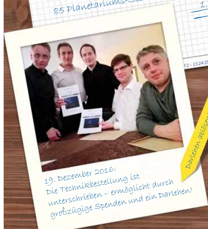
19. Dezember 2016: Die Technikbestellung ist unterschrieben – ermöglicht durch großzügige Spenden und ein Darlehen!