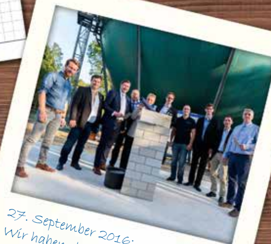
27. September 2016: Wir haben den Grundstein für das Galileum gelegt!

12 - 332425 - info@sternwarte-solingen.de