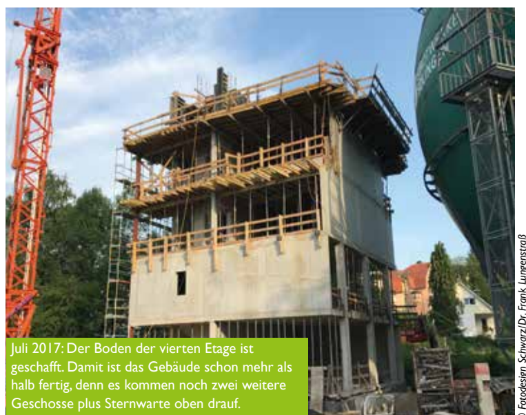
Juli 2017: Der Boden der vierten Etage ist geschafft. Damit ist das Gebäude schon mehr als halb fertig, denn es kommen noch zwei weitere Geschosse plus Sternwarte oben drauf.