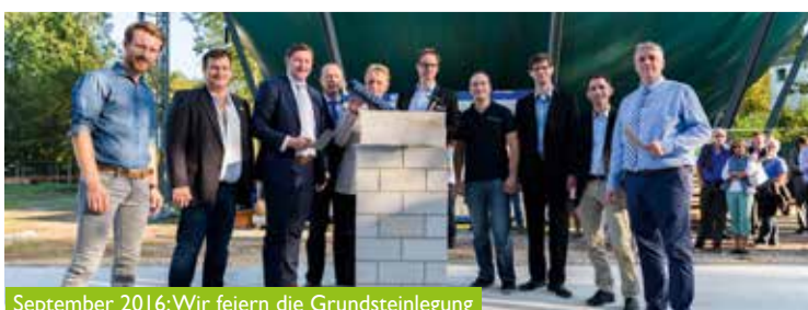
September 2016: Wir feiern die Grundsteinlegung

Über die Startseite erreichen Sie auch mit einem Klick unsere Webcam, so dass Sie live sehen können, was gerade auf der Baustelle passiert.