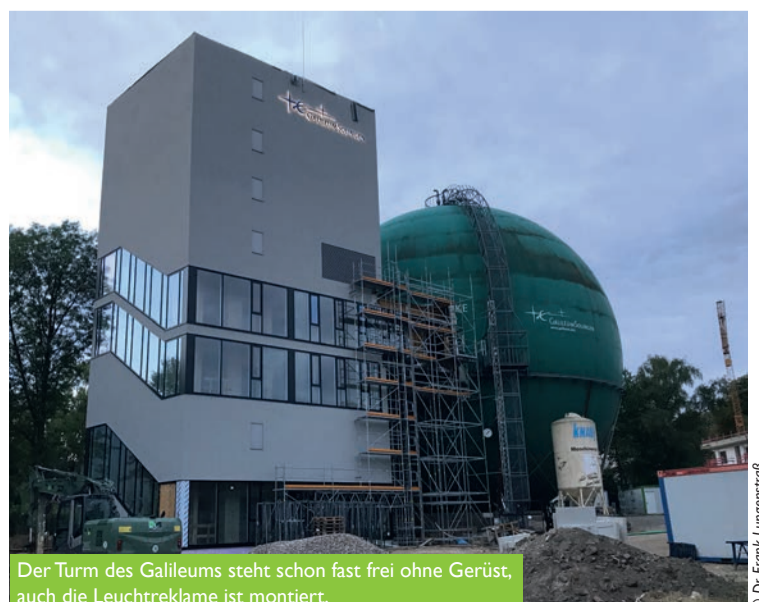
Der Turm des Galileums steht schon fast frei ohne Gerüst, auch die Leuchtreklame ist montiert.