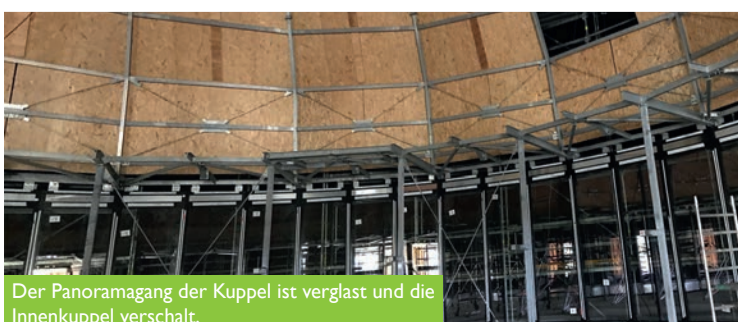
Der Panoramagang der Kuppel ist verglast und die Innenkuppel verschalt.

Über die Startseite erreichen Sie auch mit einem Klick unsere Webcam, so dass Sie live sehen können, was gerade auf der Baustelle passiert.